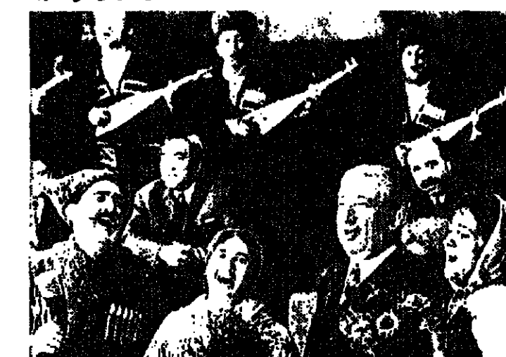
رسول حمزاتوف في عيد الايفنية

يقول الشاعر: نادرا ما اشاهد برامج التلفزيون ، ول احدى الروايات كنت اشاهد برنامج «نادي الاحداث» تصعدت مدير البرنامج من جزيرة في التسكيب يطلق عليها اسم «جزيرة النساء» . فترسخت هذه التسمية في مخيلتي على الورق